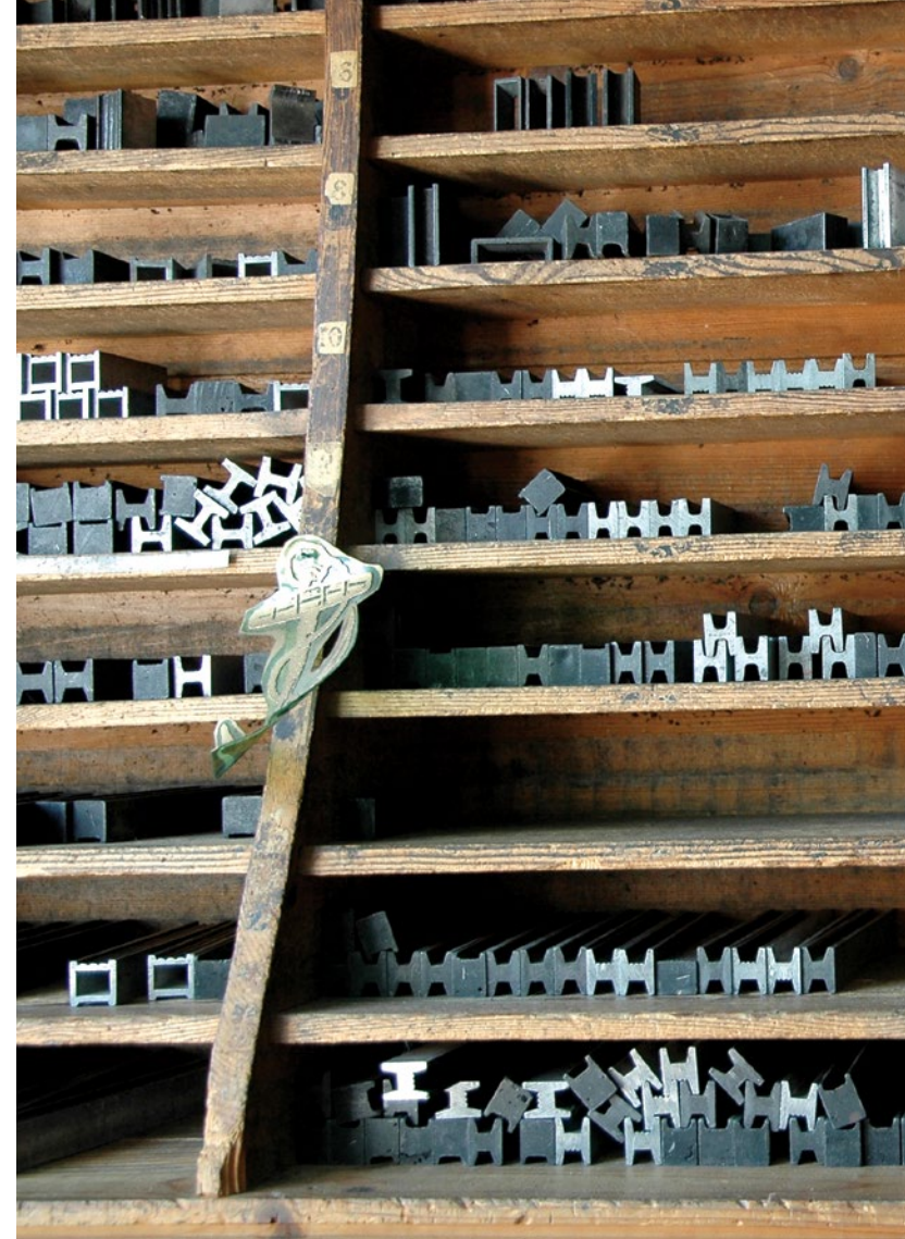
Soigneusement rangés sur les étagères du lingotier, les lingots - blocs de plomb ou d'aluminium - servent à compléter la forme de composition.