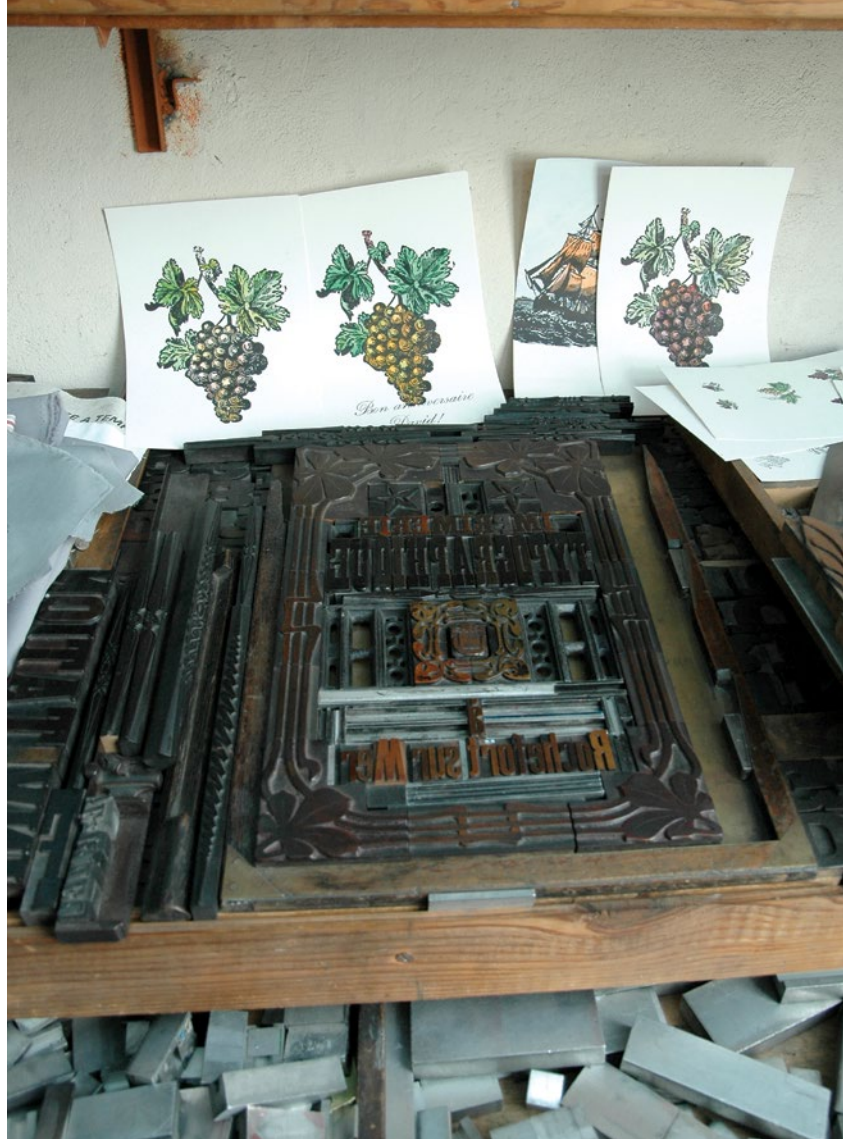
Exemple d'une forme composée, prête pour l'impression d'une affiche.