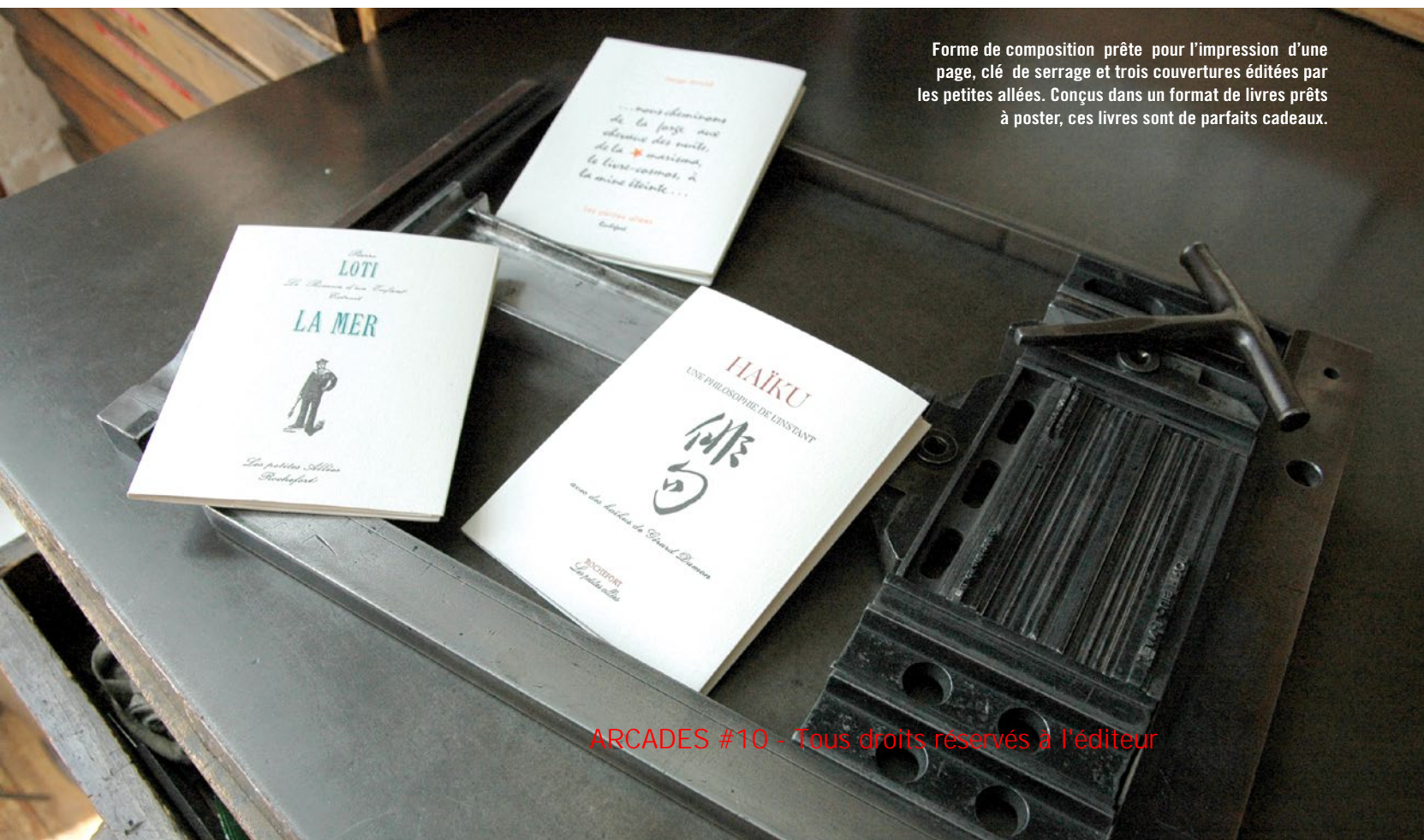
Forme de composition prête pour l'impression d'une page, clé de serrage et trois couvertures éditées par les petites allées. Conçus dans un format de livres prêts à poster, ces livres sont de parfaits cadeaux.