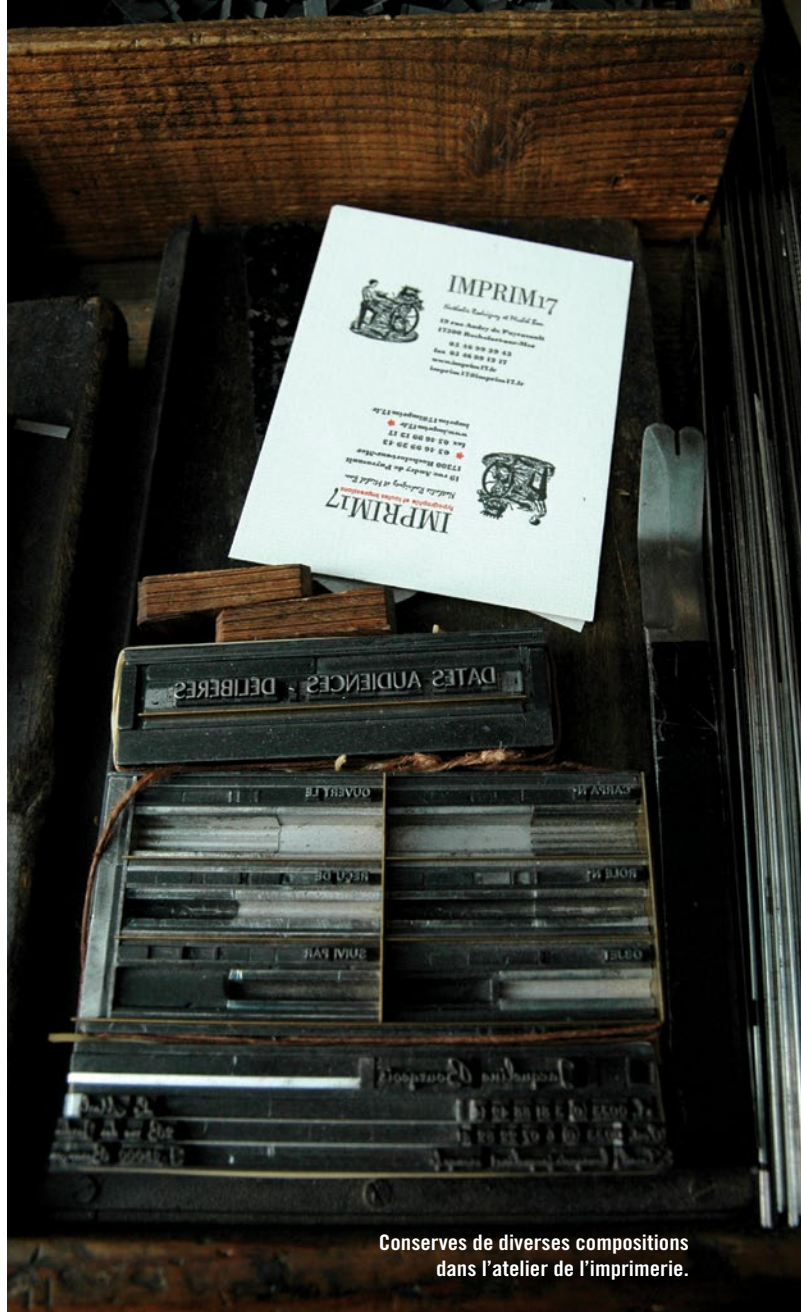
Conserve de diverses compositions dans l'atelier de l'imprimerie.