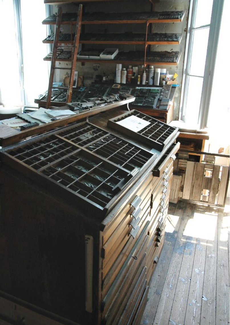
Le rang de casses, meuble de métier où sont rangés les différents caractères, atteste de l'ancienneté de l'imprimerie.